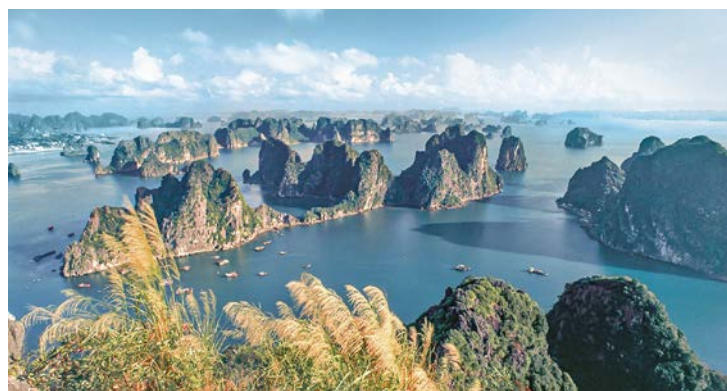
Die Halong-Bucht in Vietnam

Mit einer Fläche von über 1.800 Quadratkilometern ist der Komodo-Nationalpark die Heimat von Wildwasserbüffeln und 5.000 Echsen. Der Nationalpark umfasst mehrere Inseln, darunter Komodo, Rinca und Padar. Seine Landschaft ist von zerklüfteten Klippen und tiefen grünen Tälern geprägt. Eine private Bootstour auf einem traditionellen Phinisi-Boot verschafft Zugang zu dieser einzigartigen Welt.