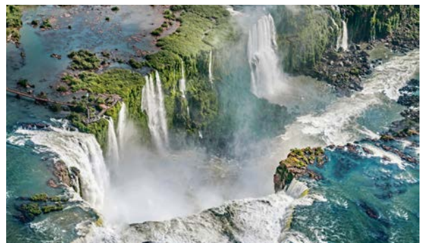
Iguazu – Wasserfälle gewaltigen Ausmaßes

Der Anblick des Wassers, das in einer gewaltigen Gischt aufsteigt und in Regenbogenfarben schillert, ist atemberaubend. Der Iguazu-Wasserfall erstreckt sich über eine Länge von rund 2,7 Kilometern von Brasilien bis Argentinien und stürzt an bis zu 270 Stellen in die Tiefe. Wanderwege führen durch den Nationalpark, die einen fantastischen Blick auf das Naturwunder bieten. Bei einer Spritztour per Boot erleben Abenteuerer den Wasserfall hautnah.