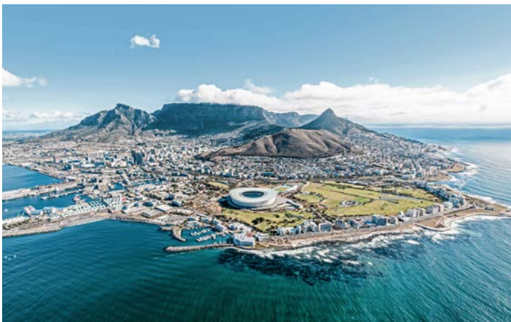
Der Tafelberg in Kapstadt