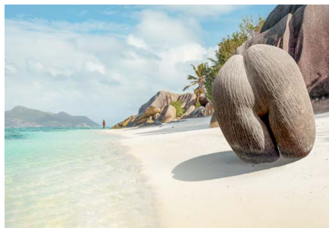
Bis 50 Zentimeter groß und bis 50 Kilogramm schwer: Coco de Mer