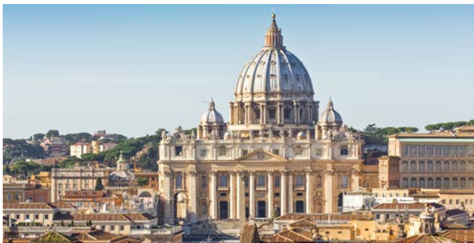
Die Basilika Sankt Peter im Herzen Roms: der Petersdom