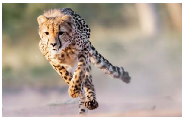
Rekordhalter in Sachen Geschwindigkeit: der Gepard

Unser Hoteltipp: Cheetah Plains Private Game Reserve ♦♦♦♦ (JNB80029)