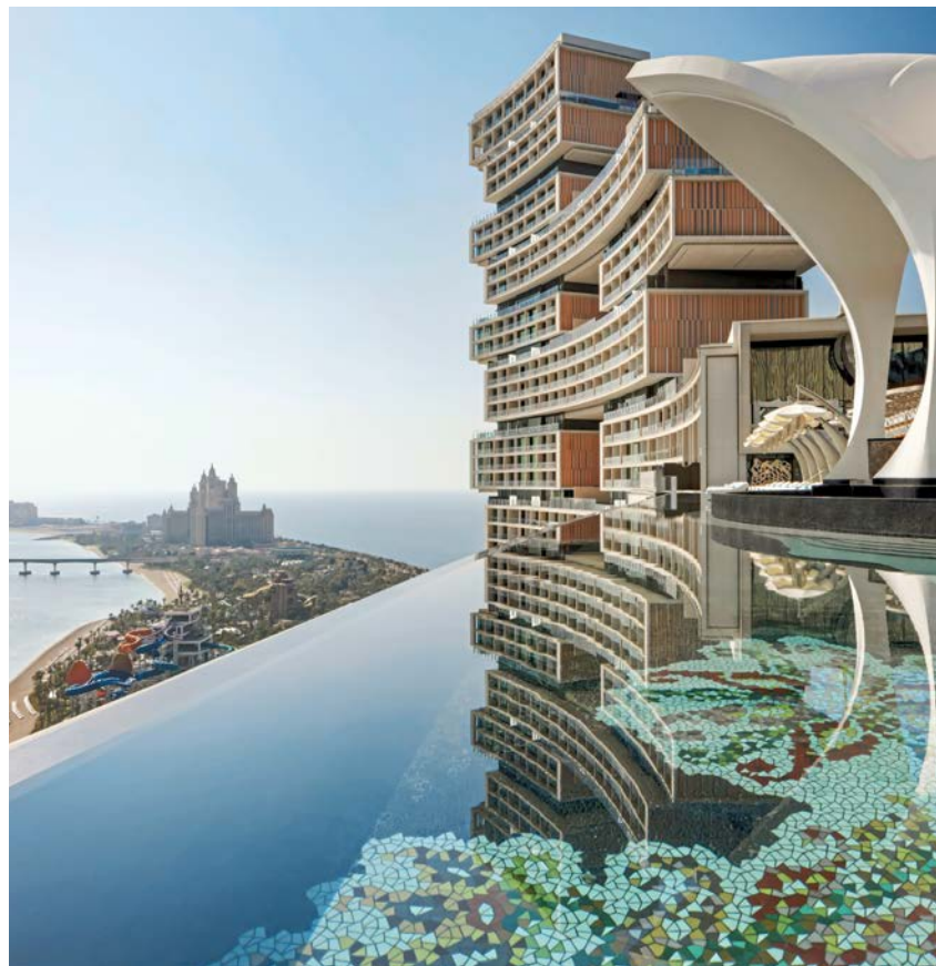
Atlantis The Royal, Dubai