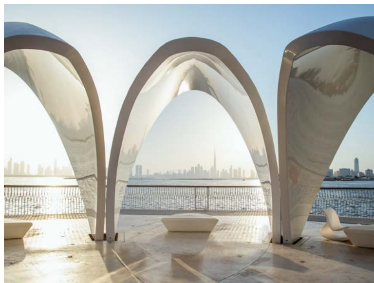
Hafen mit Aussicht: Blick über den Dubai Creek auf die Skyline

In unmittelbarer Nähe zur Metropole liegt die Wüste Al Marmoom. In ihr befinden sich faszinierende Naturphänomene wie die majestätische Düne „Big Red“ und Felsen, die wie gigantische Wächter des Wüstenlands viele Meter hoch und teils in bizarren Formen aus dem Sand in die Höhe ragen. Wer die Wüste auf actionreiche Art erkunden will, steigt auf einen Buggy oder ein Quad. Bei diesen Ausflügen geht es rasant über Dünen hinweg. Alternativ nimmt man als Co-Pilot in einem klimatisierten Allrad-Geländewagen oder einem offenen Jeep Platz. Romantiker wiederum erkunden die dubaische Wüste auf dem Rücken eines Pferdes. Wofür man sich auch begeistert: Al Marmoom hält für jeden sein eigenes Abenteuer bereit.