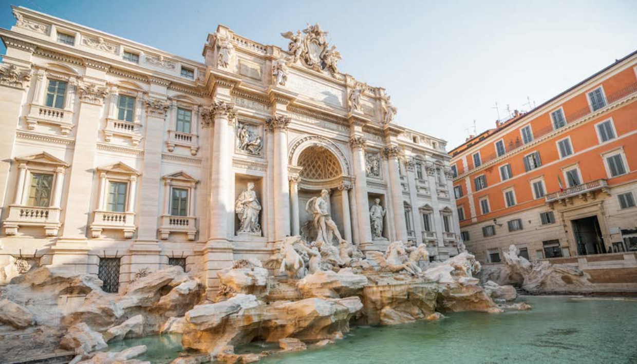
Fontana di Trevi