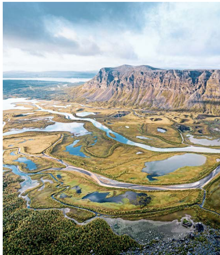
Nationalpark Puerto Princesa Subterranean

Das Wahrzeichen Kapstadts ist selbst aus weiter Ferne unverkennbar. Sein Plateau auf einer Höhe von etwa 1.000 Metern ist auf unterschiedlichen Wegen zu erreichen: Der Platteklip Gorge Trail ist ein beliebter Wanderweg auf den Tafelberg, während auf dem India Venster Trail auch mit kurzen Kletterpartien zu rechnen ist. Bequemer geht es mit der Seilbahn. Oben angekommen eröffnet sich ein weiter Blick auf Kapstadt und den Lion's Head, auf das schicke Camps Bay und die Bergkette der 12 Apostel.